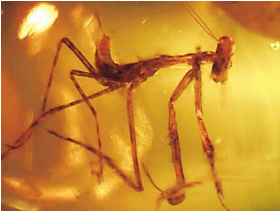
Фото 1. Нимфа богомола в янтаре