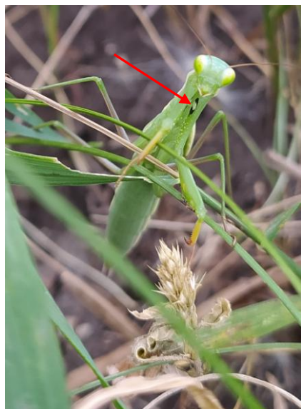
Фото 2. Богомол обыкновенный

Биологическое латинское название рода Mantis – от древнегреческого слова μάντις «богомол», а также «прорицатель». Значение «богомол» древнегреческое слово приобрело в связи с тем, что в охотничьей позе насекомое похоже на молитвенно сложившего руки человека.