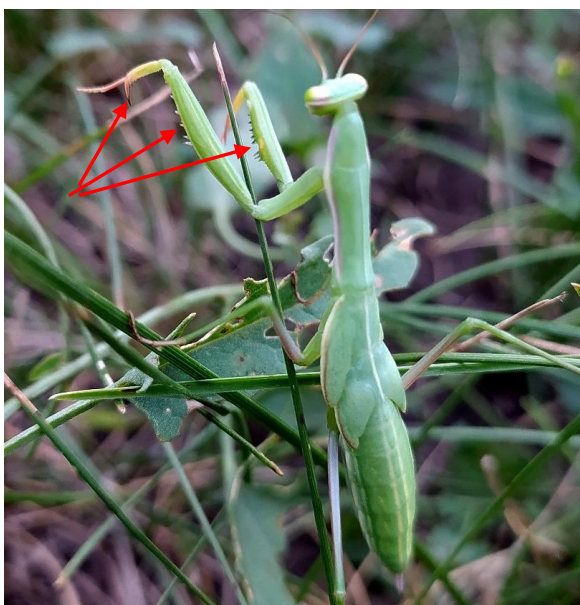
Фото 4. Шипы на кисти и голени

Грудь большинства видов относительно плоская, сдавлена спереди назад, у некоторых видов может быть лопастеобразно расширена, у других наоборот – почти цилиндрическая. По этому признаку Отряд Богомоловые родственен отряду Таракановые и отряду Термиты.