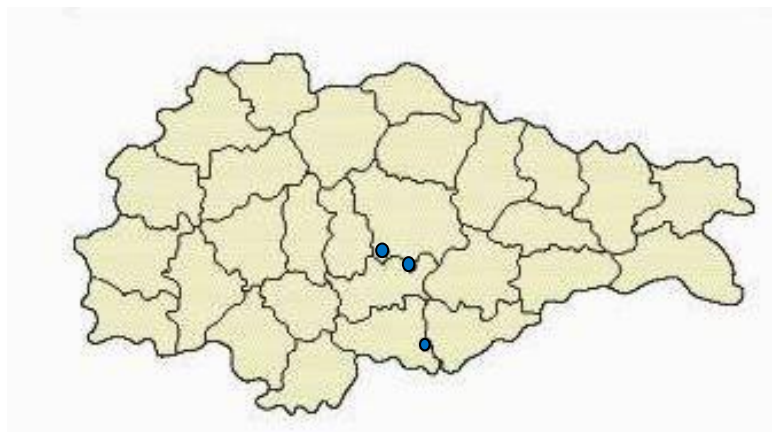
Рис.1. Распространение богомола обыкновенного на территории Курской области (2002 г.)