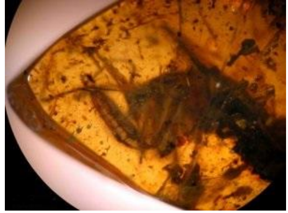
Фото 2. Богомол в меловом янтаре