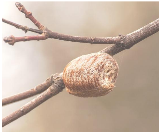
Фото 1-2. Оотека богомола обыкновенного