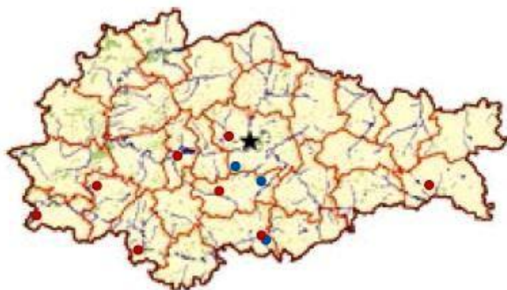
Рис.2. Распространение богомола обыкновенного на территории Курской области (2018 г.)