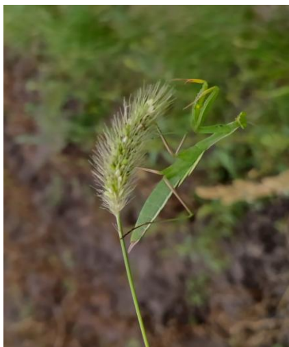
Фото 1. Богомол